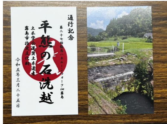
写真-7 通行記念カード(表面と裏面)

その他、来訪者には上記の説明用チラシに加え、図-7のような名刺サイズの通行記念カードも配布した。今回は 500 枚のカードを準備したが、多くの方に訪れていただいたためすべて配布することができた。