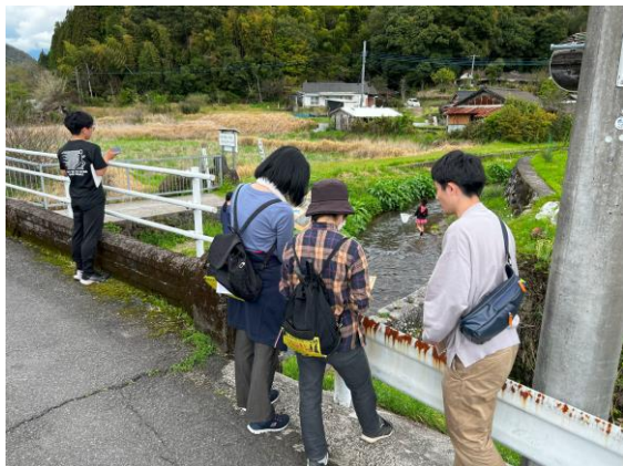
写真-6 検討した視点場での解説

訪れた人が石洗越の仕組みや役割の理解を助けるためのツールとして利用可能であることがわかった。その他、「身近にこんな面白いものがあるとは知らなかった」、「知人を連れてまた来たい」といった感想も得られた。これは、石洗越の仕組みを理解するという、いわば「謎解き」とも言える体験を通すことで、土木遺産に対するより深い興味を喚起しうることを示唆している。