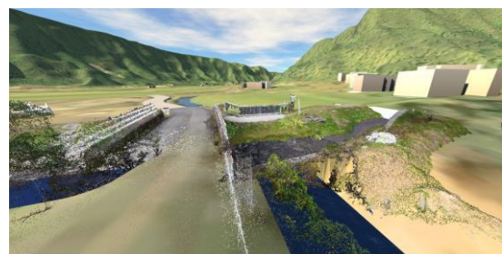
図-4 空間構成を理解するための視点場(点群データ)

統合モデルは、建造物の周辺を任意の視点から自由に観察することができる。この特性を利用して石洗越周辺を仮想的に探索した結果、図-4 に示す視点場が見