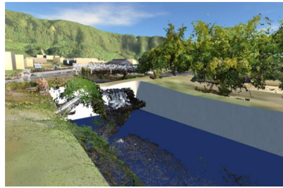
図-5 春山台地を背景とする落差工への眺望

実際に来訪者に説明した際には、この LOD200 のモデルと現場を交互に確認してもらい形で解説を実施することにした。ただし、多くの来訪者が見込まれる現地において、モデルを PC 上で表示しながら解説する