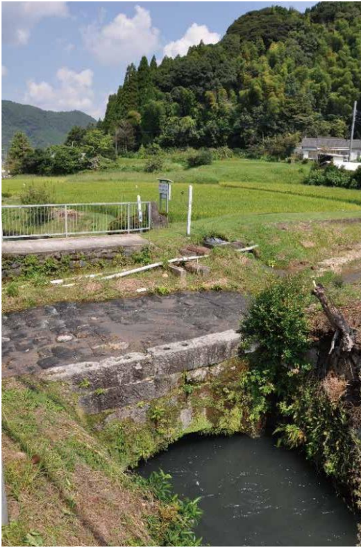
写真-3 空間構成を理解するための視点場(現場)

出された。この視点場からは、石洗越の石造アーチ橋部分を中心に、橋面の石畳を流れる竹山川とアーチ下を流れる松永用水路の全体が視野に入ることが確認できる。実際の現場の様子を写真-3 に示す。