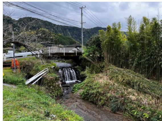
写真-4 左岸側の竹藪伐採後