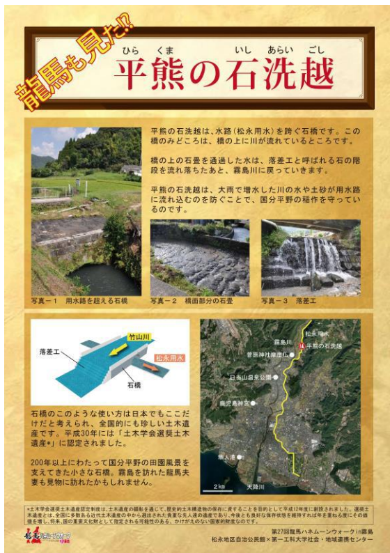
図-6 現地説明用に作成したチラシ