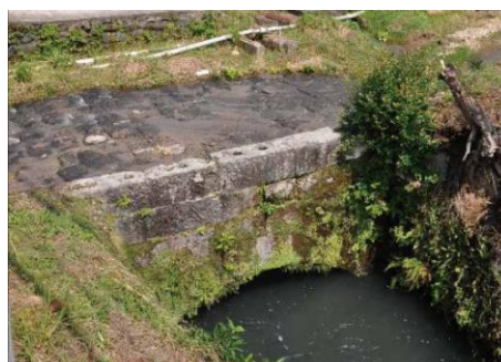
写真-1 石造アーチ橋部分

石洗越のある地域では10年ほど前から活用を見越した周辺の環境整備に取り組んでおり、これまでに地域内散策コースの一部として位置づけられたり、土木工学を学ぶ大学生の現地学習のための教材としても利