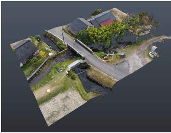
図-1 平熊の石洗越の点群データ