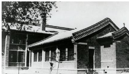
（写真1）キリスト教系の学校であった崇貞学園

その後の中国は、文化大革命に関連する国内政治の嵐を経験することとなったが、改革開放の時期を迎えたことにより、新たに中国で私立学校が設置されるきっかけとなった。