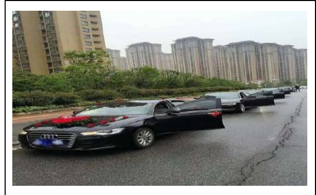
(写真2)現代中国の「親迎」の例