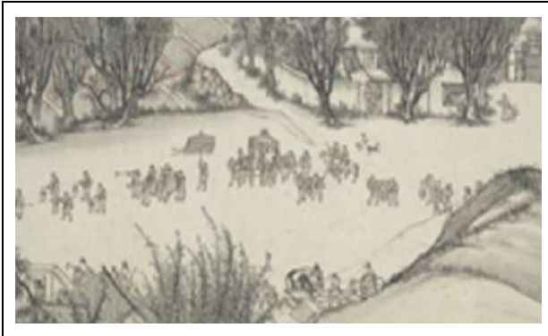
(写真1)『清院本清明上河図』の一部