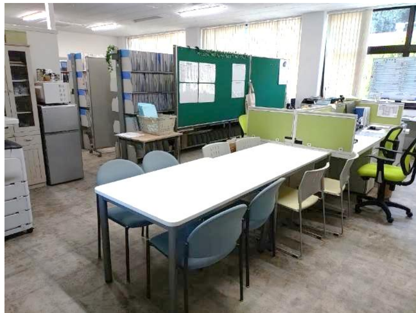
就職・厚生課（各種手続き等）