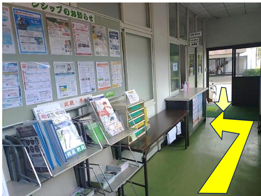
掲示板（説明会・インターンシップ等の案内）