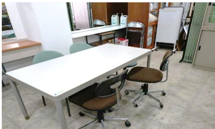
就職閲覧室（企業パンフレット、インターネット環境、面談室）